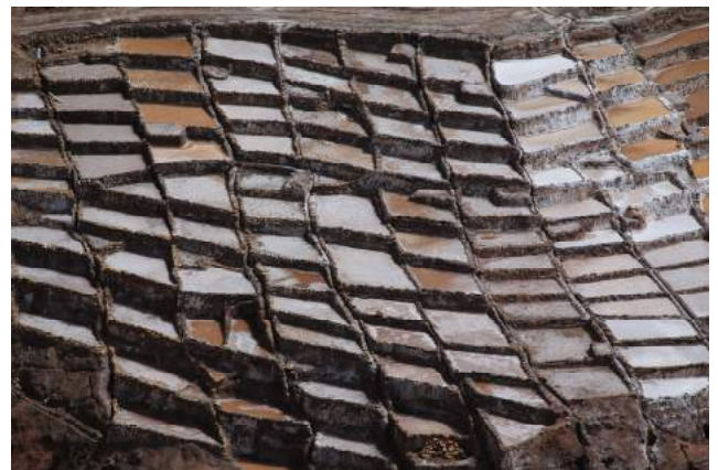
Salines de Maras

Découverte du petit village Chinchero et visite des ruines de Moray, lieu d'expérimentation inca pour développer l'agriculture et l'acclimatation des plantes d'autres régions de l'Empire Inca. Poursuite du voyage jusqu'aux superbes salines de Maras. Datant de l'époque pré-inca, l'activité de ces salines continue aujourd'hui. Route en bus vers le village pittoresque d'Ollantaytambo. Visite de cette imposante forteresse surplombant le Rio Urubamba qui représente un des vestiges les plus parlants de l'urbanisme Inca. Dans l'après-midi, départ en train vers Aguas Calientes. Nuit à l'auberge.