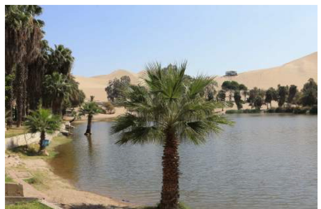
Oasis de Huacachina