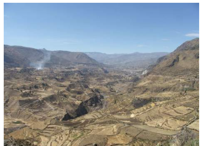
Canyon de Colca