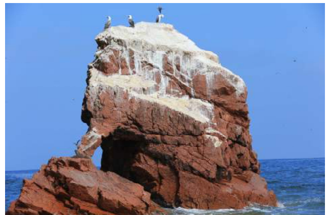
Réserve nationale de Paracas

Visite des Iles Ballestas en bateau, dans la réserve Nationale de Paracas (depuis 1975). Durant le parcours, nous pourrons observer de nombreuses espèces animales telles que des phoques, des manchots, des cormorans et autres oiseaux aquatiques, et admirer les plages de Paracas comptant parmi les plus belles du pays. Au retour, nous aurons l'occasion de découvrir le "Candélabre", dessin gigantesque gravé dans le sable sur le versant d'une colline. Déjeuner dans un restaurant de l'oasis de Huacachina, à côté d'Ica, visite de l'Oasis, puis nuit dans les environs selon les disponiilitées.