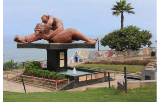
Parque del amor (Lima)

Dans la matinée, vol pour Lima. Visite du centre-ville, du quartier Colonial de Barranco et du quartier de Miraflores. Soirée dans un centre culturel avec démonstration de danses folkloriques péruviennes. Nuit chez la famille