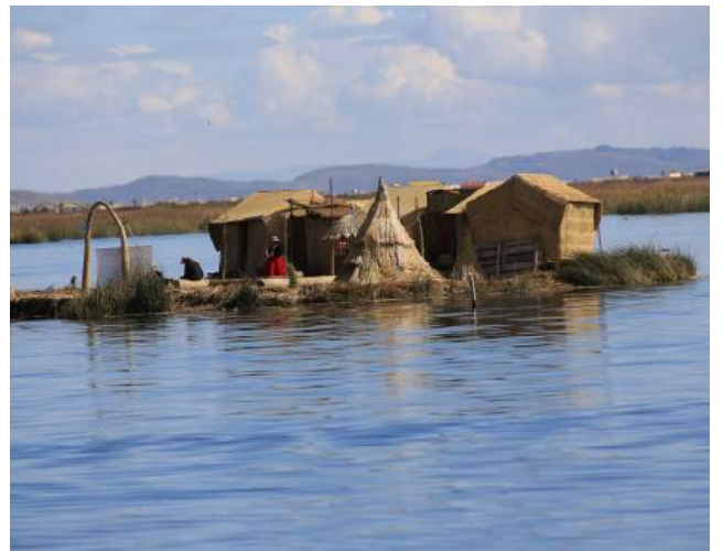
Îles flottantes Uros

Dans la matinée, embarquement sur un petit bateau vers l'île d'Amantani (3h de navigation). Arrêt sur les îles flottantes peu fréquentées de Titino, construites à partir de la totora, une variété de roseaux qui pousse au fond du lac. Nous sommes accueillis sur les îles par l'ethnie Aymara, dont nous découvrons le mode de vie particulier. Poursuite vers l'île d'Amantani située à 3800 m d'altitude. Déjeuner avec les familles, rencontre et partage avec cette population insulaire accueillante, au mode de vie traditionnel. L'après-midi, promenade dans les environs, participation aux activités du village... Dîner et nuit chez l'habitant.