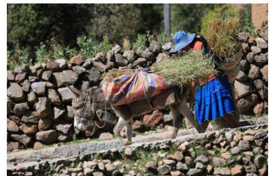
Transport de marchandises sur l'île Amantani