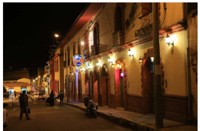
Place d'arme de Puno