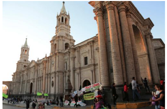
Église de la cathédrale à Aréquipa

Arrivée à Arequipa en début de matinée. Transfert pour le "quartier jeune" de Cayma, où l'association Rayo de Sol, jumelle de l'association "Bambins des Bidonvilles", nous accueille pour un petit-déjeuner. Découverte de l'association ; visite de la crèche et de la boulangerie dont la construction a été cofinancée par le fonds de développement Pérou de Vision du Monde. Retour en centre-ville où nous visitons le couvent Santa Catalina, la Place d'Armes et le marché San Camilo. Déjeuner à Cayma, et transfert pour le village de Coporaque, au bord du majestueux Canyon de Colca.