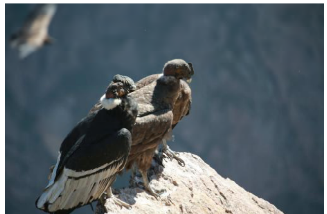
Condors, depuis le bord du Canyon de Colca

Le matin, départ pour une balade sur la rive droite du Canyon de Colca, l'un des canyons les plus profonds du monde (2h de marche). L'itinéraire en balcons nous mène au coeur du canyon où nous traversons le río Colca avant de rejoindre le charmant village de Yanque, ancienne capitale de la vallée à l'époque coloniale. Durant le parcours, nous pourrions admirer les volcans Ampato, Sabancaya et Hualca Hualca, ainsi que des troupeaux de lamas, d'alpagas et de vigognes (camélidés d'Amérique du Sud). A Yanque, visite du musée et pique-nique dans ses jardins. Nous nous rendons ensuite aux sources thermales de Chivay, pour nous détendre dans les eaux chaudes aux vertus thérapeutiques. Retour à Coporaque en véhicule. Dîner et nuit chez l'habitant.