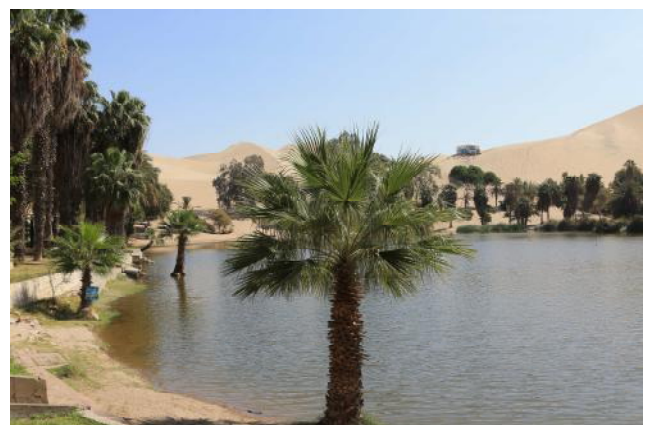
Oasis de Huacachina