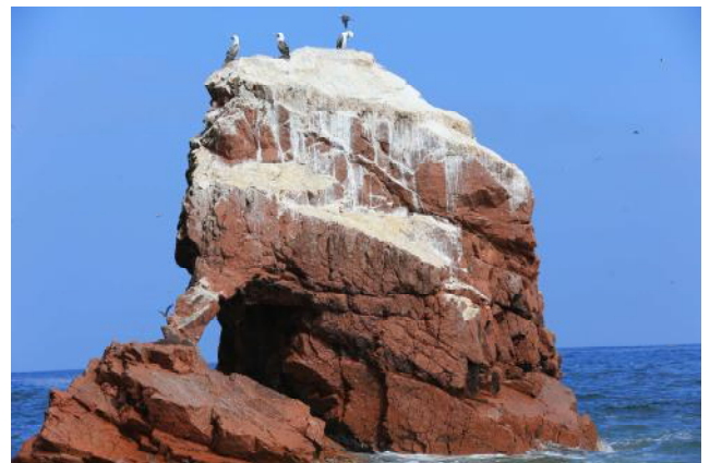
Réserve nationale de Paracas

Route vers Paracas, petit port de pêche à 16 km au Sud de Pisco. Dans la matinée, visite des îles Ballestas en chaloupe, dans la réserve Nationale de Paracas, classée depuis 1975. Durant le parcours, nous pourrons observer de nombreuses espèces animales telles que des phoques, des manchots, des cormorans et autres oiseaux aquatiques, et admirer les plages de Paracas comptant parmi les plus belles du pays. Au retour, nous aurons l'occasion de découvrir le "Candélabre", dessin gigantesque gravé dans le sable sur le versant d'une colline. Déjeuner dans un restaurant de l'oasis de Huacachina, à côté d'Ica, puis départ en bus pour Nazca (4h), petite ville situé au milieu de la Pampa, immense plateau désertique. Dans l'après-midi, survol des lignes mystérieuses, gravées à même le désert de Nazca et s'étendant sur des dizaines de kilomètres. Dîner, puis route en bus couchette (572 km) vers Arequipa, la "Ville Blanche", nommée ainsi pour ses édifications en sillar blanc, pierre volcanique provenant du volcan Misti.