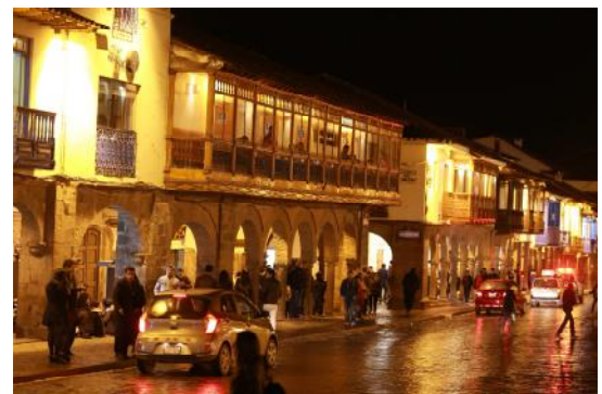
Une rue de Cuzco