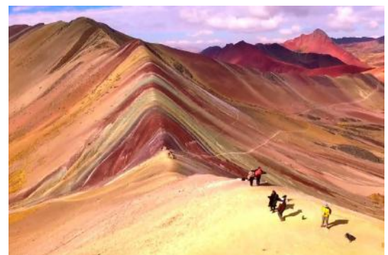
La montagne Vinicunca