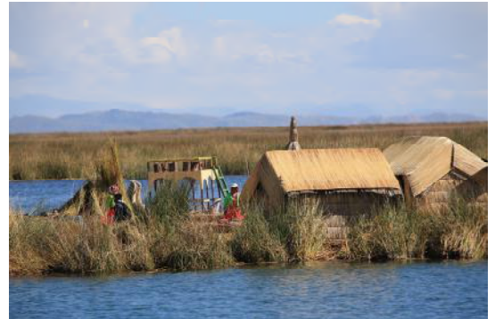
Îles flottantes de Uros

Dans la matinée, embarquement sur un petit bateau vers l'île d'Amantani (3h de navigation). Arrêt sur les îles flottantes peu fréquentées de Titino, construites à partir de la totora, une variété de roseaux qui pousse au fond du lac. Nous sommes accueillis sur les îles par l'ethnie Aymara, dont nous découvrons le mode de vie particulier. Poursuite vers l'île d'Amantani située à 3800 m d'altitude. Déjeuner avec les familles, rencontre et partage avec cette population insulaire accueillante, au mode de vie traditionnel. L'après-midi, promenade dans les environs, participation aux activités du village... Dîner et nuit chez l'habitant.